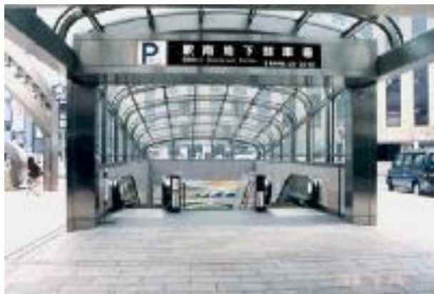
駅南地下駐車場入口

不法駐輪をなくすには逆転の発想が必要となる。それは、自転車利用者にとって最も便利な場所に、必要な台数を収容できる駐輪場を設置することで解決できる。最も便利な場所とは、駅南の地下駐車場である。LRTを中心とした新交通システムが実現すると、都心部に流入してくる一般車両は原則としてなくなるので駅南地下駐車場も不要