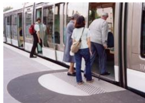
ストラスブール(フランス)のLRT