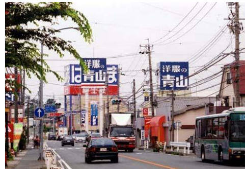
景観を無視した巨大看板

都市には大小さまざまな商業サインが氾濫しており、電柱同様に都市の景観を損ねている。そのため、公共施設への案内・誘導や交通安全上必要な公共サインが商業サインの中に埋没し、本来の機能を果たしていない。企業は自社を宣伝する権利を有するとともに、都市景観を守る義務を有することを明確にし、美しい都市景観を守り創造していくことが必要となる。