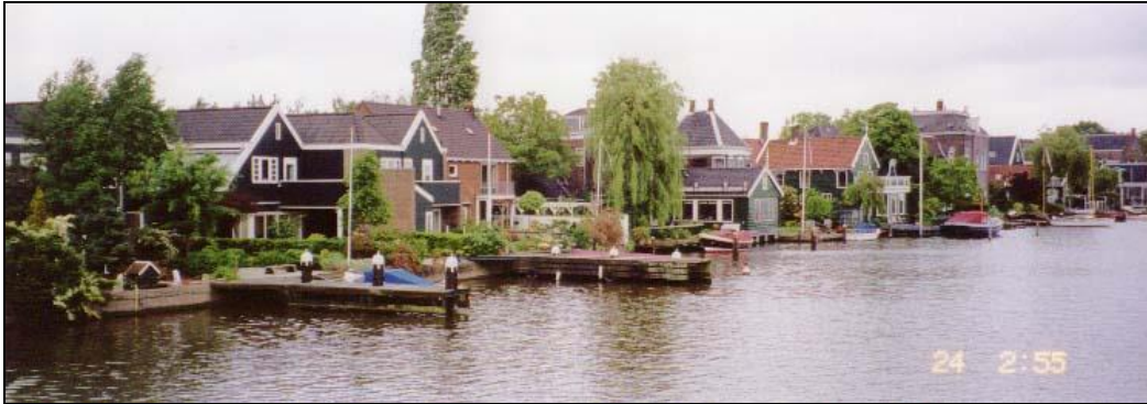
水辺に建つ住宅(オランダ)

れている。全長6kmの運河を巡らせ、水際には自然石が積み上げられている。石積みには貝や藻が付着し魚たちがやってくる。その魚を追って水鳥が集まる生態系が生まれている。運河は潮汐の干満を利用して海水が循環するように計画されている。さらに河底の清掃管理までも配慮した設計がされており、環境対策は学ぶところが大きい。浜名湖は不法係留による環境問題を抱えているが、運河を巡らすことで、ヨットハーバーを設置できるので、不法係留も一掃されることになる。