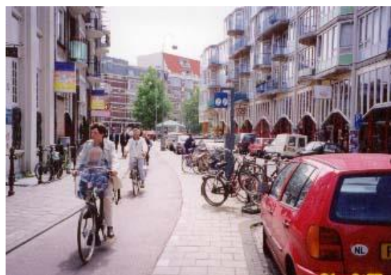
アムステルダムの自転車専用レーン

これまでの日本は、車優先の社会システムが繁栄をもたらしてくれた。しかし、これからは環境を犠牲にした繁栄よりも、人にも環境にも優しい交通システムが求められる。自転車をクリーンビークルとして優れた乗物として認め、邪魔者としてではなく新都心の新しいモビリティとして、安全に利用できるシステムを築いていく必要